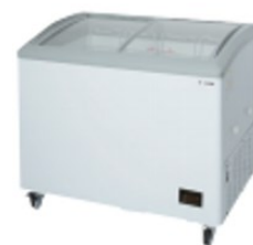
ノンフロンアイスケース