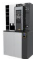
VS CRYSTA (クリスタ自販機)