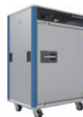
RevoCool (移動式定温保管庫) 【参考出展】