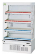
ノンフロンショーケース