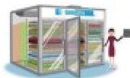
スマートウォークイン 【参考出展】

具体的には「操作・レイアウト、棚の形状」の3つを自由化した MMS(マルチ・モジュール・ショーケース)や、コンビニやスーパー等の飲料ショーケースの補充を自動的に行うことができるウォークイン補充システムも今回参考出展という形で紹介します。深夜などの時間を問わず商品を補充することが可能となり、従業員の省力化に繋がる提案となります。