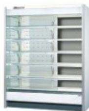
ハイブリットショーケース