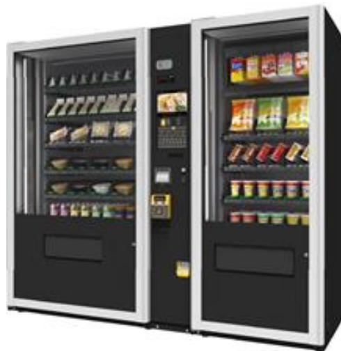
新機能を搭載したマルチ・モジュール・ベンダーMMV

業界初 自動販売機にまとめ買い機能を搭載！ 1回のアクションで全ての商品の購入が可能に