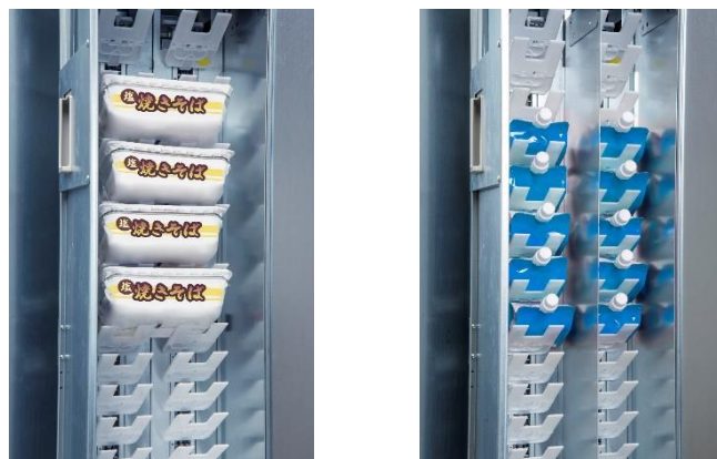
マルチエレベーター(可動式収納棚)

自由に高さ等を設定できるプラスチック製の可変の商品棚を初めて採用したことで、商品の収納の自由度が飛躍的に向上しました。これにより今までストックが難しいとされていた袋物の商品や軽量の商品への対応も容易となります。