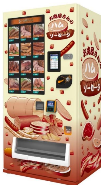
ラッピングをした状態の「ど冷えもん MULTI」