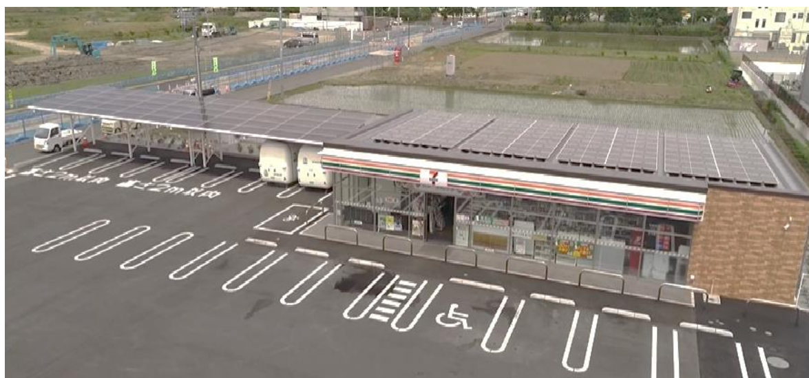
「セブン・イレブン三郷彦成2丁目店」外観

各社は、実証実験による効果検証に積極的に取り組み、カーボンニュートラルに向けた取り組みを加速させ、社会課題への対応を推し進めてまいります。