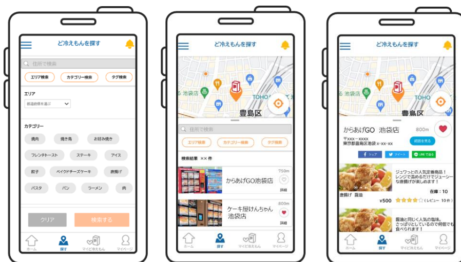
＜「ど冷えもん GO」検索画面—位置情報＞

具体的には「ど冷えもん GO」を使うことで「ど冷えもん」の設置場所、在庫状況および商品情報の検索が可能となります。「ど冷えもん」の設置場所の検索を行う場合、スマートフォンの位置情報検索アプリと連動しているため、「ど冷えもんを探す」というページから特定のエリアや商品のカテゴリー、さらにはタグを基に検索することで、「ど冷えもん」の設置場所が表示されます。経路表示機能を活用することで、気になる「ど冷えもん」までの経路もすぐに分かります。