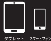
タブレット スマートフォン

各種マシンの設定、販売データの確認、マシン状態の確認が簡単にできます。専用アプリはiOSとAndroidに対応、App Store、Google Playからダウンロードができます。