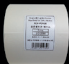
専用ペーパーフィルター RCM-PEPA90 1100杯/ロール