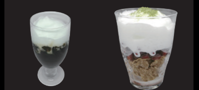
コーヒーゼリーに 新しいデザート創作に