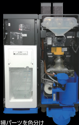
清掃パーツを色分け